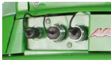
Prises hydrauliques à l'arrière