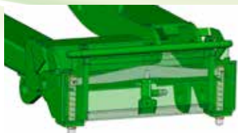
Platine d'accrochage hydraulique