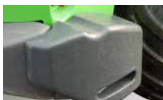
Masses latérales, 180 kg