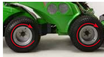
Valve anti patinage