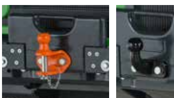
Masses, crochet d'attelage