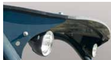
Kit phares de travail