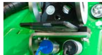
Double prise hydraulique à l'avant