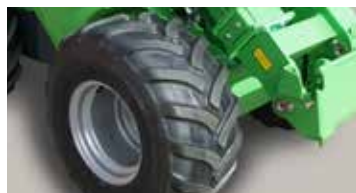
Pneumatiques extra forts