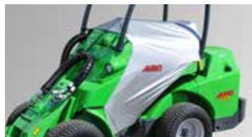
Housse de protection