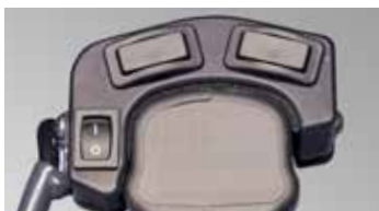
Kit interrupteurs pour accessoire