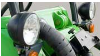
Kit phares, clignotants, réflecteurs