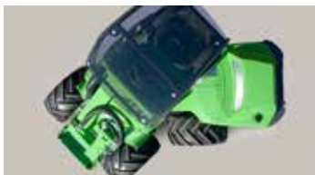
Valve débloccage de marche