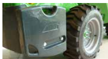
Masses latérales, 80 kg