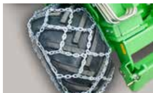
Chaînes à neige