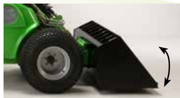
Flottation bras de levage